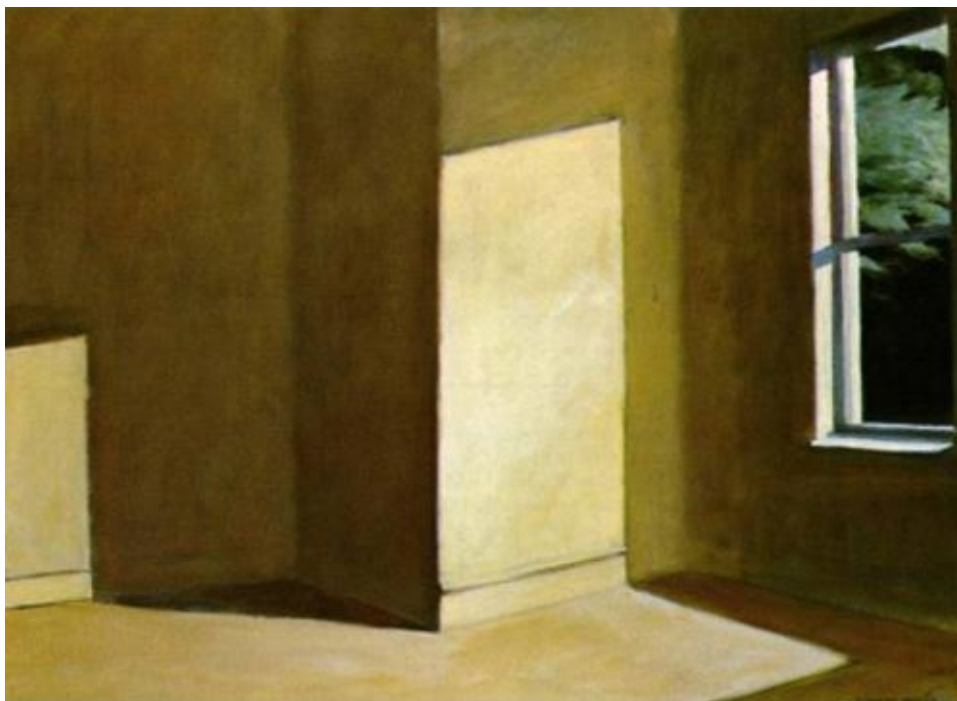
Edward Hopper, Sun in an Empty Room , 1963.

La obra pictórica de madurez de Edward Hopper (1882-1967) está muy construida pero presenta múltiples incongruencias en la representación lógica de las sombras, que son, en cambio, aceptables desde el punto de vista de un espectador no atento o informado.