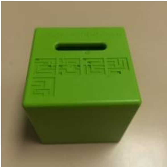
Un Inside3 Cube El Molecube

hay un laberinto. Por una cara se ve una ranura en la que inicialmente se puede ver una bola. El cubo debe moverse para que la bola se vea por otra ranura que hay en la cara opuesta. Para sacar la bola por la otra cara tenemos una pequeña pista: en la cara original se ven los planos del laberinto: cómo son los corredores y cómo se pasa de un piso al otro. Aunque dicho así parezca sencillo, hay que echar un rato para interpretar los planos de este nivel. Tengo otros dos más difíciles y todavía no me he puesto con ellos, porque hay que dedicar tiempo de calidad.