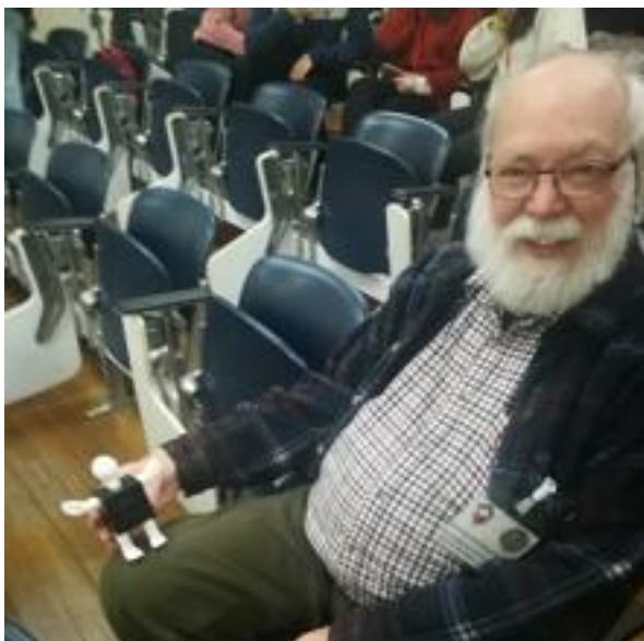
El matemático americano David Singmaster