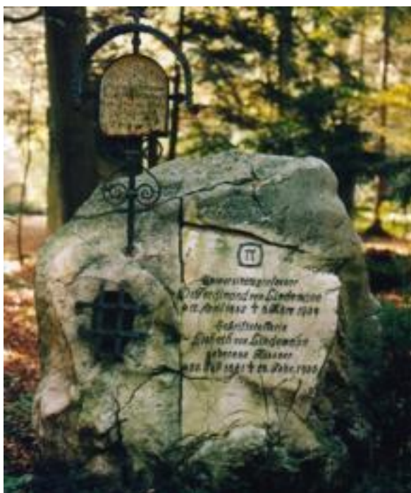
El epitafio de Ferdinand von Lindemann

El número \pi es además trascendente . Esto significa que no es solución de ninguna ecuación algebraica con coeficientes racionales. Hay números irracionales que no son trascendentes, como por ejemplo la raíz cuadrada de 2.