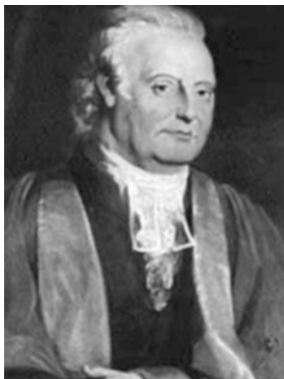
Edward Waring (1736-1798)