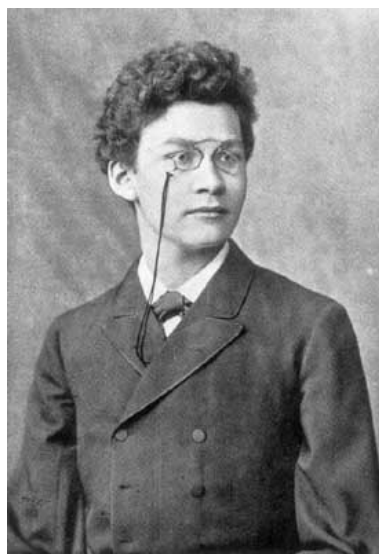
Figura 2. Hermann Minkowski

En 1892 Hurwitz se trasladó al E.T.H. (Instituto Tecnológico) de Zurich y su puesto fue ocupado por Hilbert. En 1893 Lindemann se mueve a Munich y Hilbert sube de categoría y ocupa su puesto de profesor Ordinarius (catedrático). A su vez la plaza que él deja vacante le es ofrecida a Minkowski. De nuevo volvían a estar juntos los dos amigos, pero por poco tiempo, porque en 1895 Hilbert se traslada, por una gestión directa de Klein, a la Universidad de Gotinga donde pasaría el resto de su vida. El puesto que deja vacante es ofrecido a Minkowski pero éste lo ocupa sólo un año ya que en 1896 se traslada al E.T.H. de Zurich donde volverá a coincidir con Hurwitz.