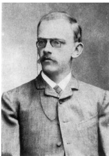
Figura 1. David Hilbert