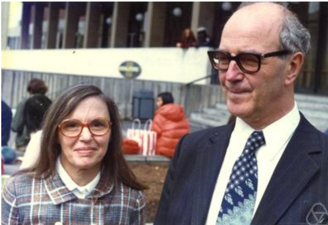
Yvonne Choquet-Bruhat y Gustave Choquet, 1974