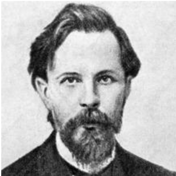
Andréi Andréyevich Markov

El matemático ruso Andréi Andréyevich Markov (1856 - 1922) destacó por sus trabajos en teoría de números (fracciones continuas), pero sobre todo en teoría de probabilidades. Nada más finalizar sus estudios, ingresó en la Universidad de San Petersburgo como profesor, siendo discípulo de Pafnuti Chebyshev . En 1887 completó la demostración que permitía generalizar el teorema central del límite, que ya había descrito el propio Chebyshev. Después de 25 años de labor académica se retiró de la universidad, dedicándose exclusivamente a impartir cursos sobre teoría de probabilidades. En su vida personal, Markov fue un comprometido activista político opuesto a los privilegios del régimen zarista, llegando a rechazar condecoraciones que le otorgaron como protesta. Murió como consecuencia de una infección tras una de las muchas operaciones de rodilla que soportó como consecuencia de las dolencias que le provocaba una malformación congénita de dicha rodilla.