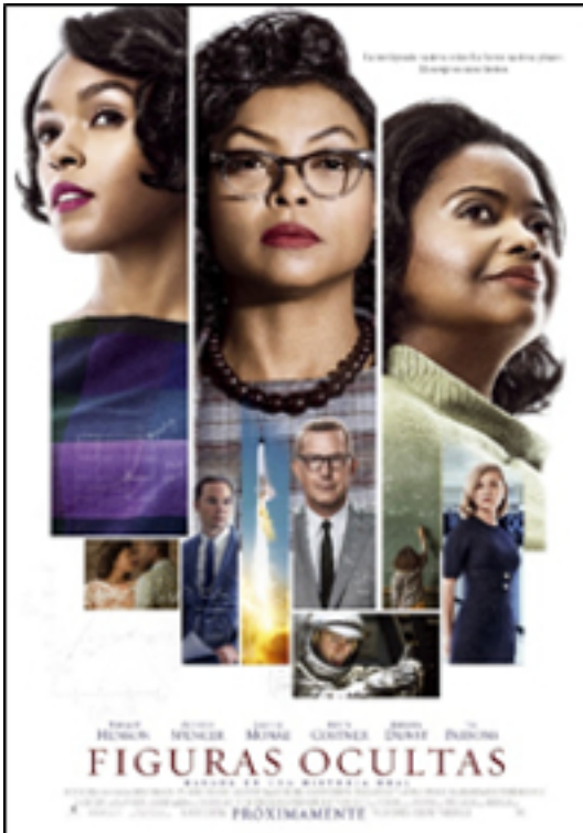
Título Figuras Ocultas, Título Original: Hidden Figures, Nacionalidad: EE.UU., Año: 2016, Direc tor: Theodore Melfino, Guionistas: Allison Janney, Octavia Spencer, Janelle Monáe, Taraji P. Penson