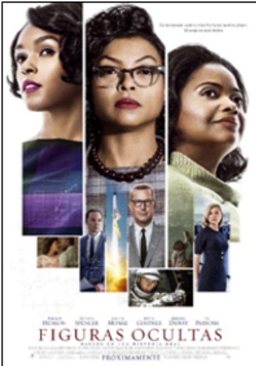
Título Figuras Ocultas, Título Original: Hidden Figures, Nacionalidad EE.UU, Año: 2016, Direc

Escrito por Alfonso Jesús Población Sáez Jueves 09 de Febrero de 2017 15:00