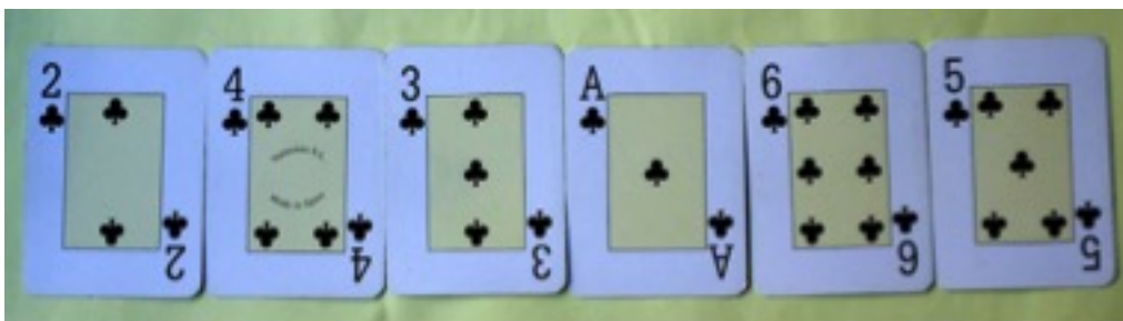
Imagen 2: Permutación de 6 ganadora.

Veamos otro ejemplo, ahora con la siguiente distribución de cartas.