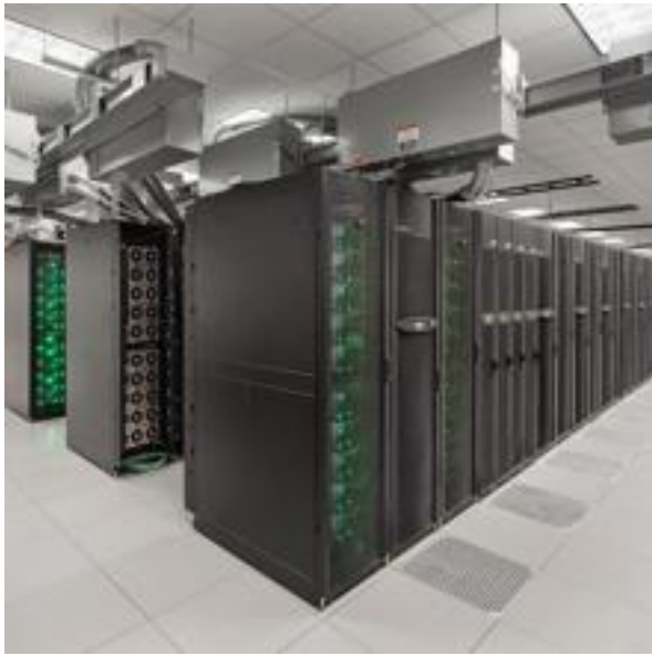
Supercomputador «Stampede» del Centro Avanzado de Computación de Texas

No sé si es lo más importante del asunto, pero el premio de 100 dólares ofrecido hace más de 30 años por el matemático y malabarista Ronald Graham ha podido ser entregado. Quizá tampoco sea relevante la conclusión de que existen 10 elevado a 2300 soluciones del problema (sí, un uno seguido de 2300 ceros) para el caso de N = 7824 . No parece razonable pensar que nadie vaya a contradecir a estos ordenadores.