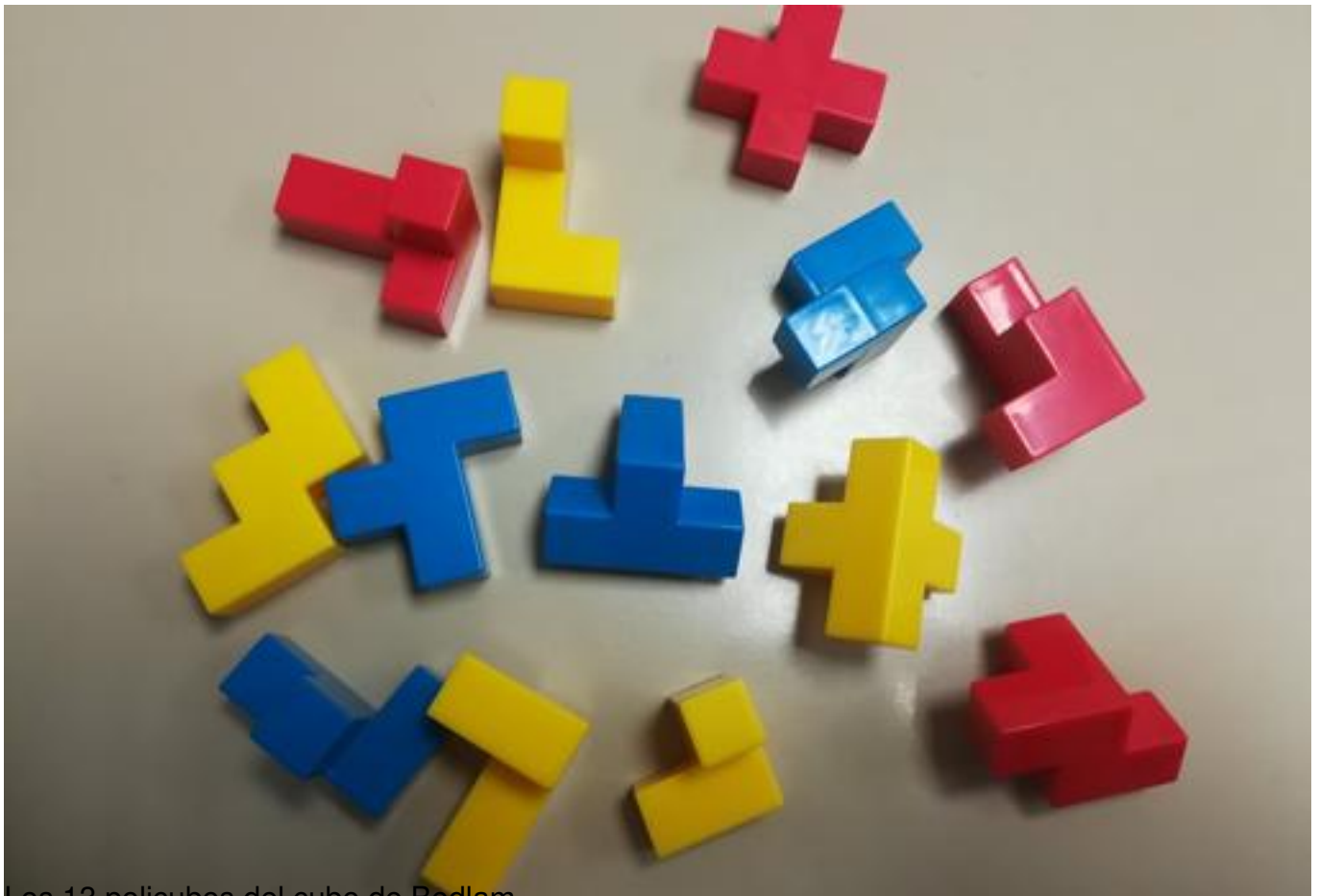
Los 13 policubos del cubo de Bedlam Digitos en caja

Una idea similar, pero mucho más sencilla de resolver, es la que nos ofrece el rompecabezas conocido como «dígitos en una caja». El problema que plantea aparentemente es muy simple : meter los dígitos de los que consta en la caja con la que se entrega. Según las propias instrucciones que se acompañan, hay más de 4.000 soluciones posibles. El inventor del juego, Eric C. Harshbarger , es profesor de matemáticas en la Auburn University de Alabama y lo ideó con ayuda de un programa de ordenador. En la imagen se observa cómo los dígitos se entrelazan para minimizar el espacio que ocupan. Animamos al lector a que se atreva a resolverlo (se recomienda para edades mayores de 8 años).